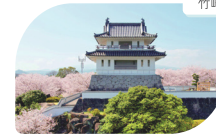
竹崎城址展望台公園

有明海の干満の差を活かした撮影スポットとして人気の海中鳥居。満潮時は鳥居の一部が海の中に沈んだ風景、干潮時には干潟の上に佇む姿が見えます。また、干潮時には鳥居の横に有明海沖へと続く、海中道路も姿を現します。 ● 佐賀県藤津郡太良町多良1874-9