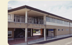
干潟交流館（道の駅鹿島）

江戸時代から続く歴史的な町並みが残る重要伝統的建造物群保存地区。酒や醤油などの醸造業を中心に発展した地域で、白壁の建物や大型の酒蔵、武家屋敷などが立ち並び「蔵通り」と「茅葺の町並み」をご覧いただけます。 ● 佐賀県鹿島市浜町乙2696