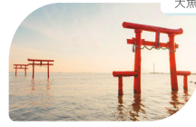
大魚神社 海中鳥居

有明海の干満の差を活かした撮影スポットとして人気の海中鳥居。満潮時は鳥居の一部が海の中に沈んだ風景、干潮時には干潟の上に佇む姿が見えます。また、干潮時には鳥居の横に有明海沖へと続く、海中道路も姿を現します。 ● 佐賀県藤津郡太良町多良1874-9